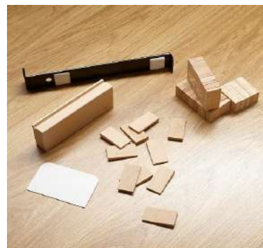
Набір Монтажний ZMM

Для більш детальної інформації відвідайте, будь-ласка, нашу сторінку на сайті http://www.agtplus.ua З питань укладання ламінату звертайтеся до Вашого менеджера. Всі позиції входять до постійної складської програми.